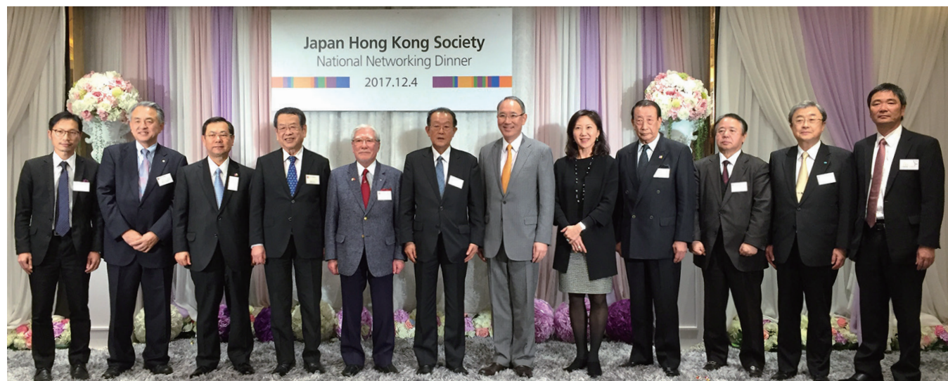
日本香港協会各地協会会長、代表者、来賓の皆様

今年ご参加いただけなかった方におかれましても、来年度は是非ご出席いただき、メンバーとの交流、ネットワーキングを深めていただければと思います。