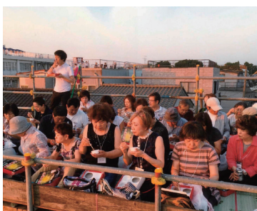
さあ、いよいよ始まるぞ、楽しまなくちゃ！

8月3日～4日と開催された「長岡まつり大花火大会」、女性部会研修会として参加してきました。参加者は総勢28名、仙台駅東口を午前9時に出発、途中会津若松市に立ち寄り昼食、その後宿となる燕三条駅傍のホテルで一旦休憩した後、長岡市内の花火会場に向かいました。