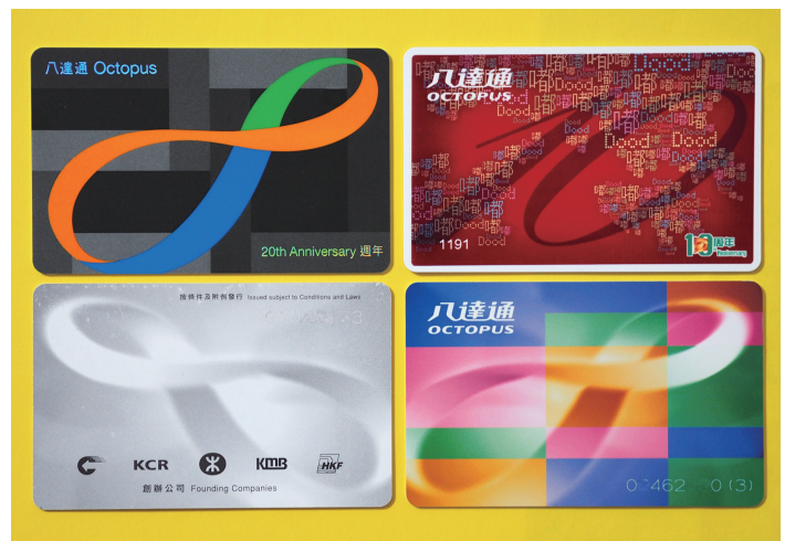
左上から時計回りに、20周年記念カード、10周年記念カード、現在流通している通常カード、初期カード裏面

香港に仕事や観光で訪れるときは、空港ですぐオクトパスを1枚買ってしまおうのがお勧めです。