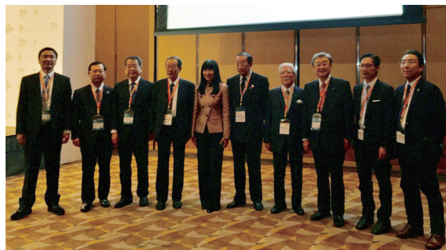
香港貿易発展局マーガレット・フォン総裁を囲む各地日本香港協会代表者の皆様

◆第18回香港フォーラムにて、日本香港協会が9年連続“ベスト・アテンダンス・アワード”を受賞！