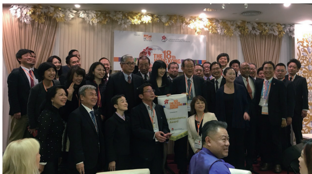
フェアウェル・ディナーにて9年連続でベスト・アテンダンス・アワードの表彰を受ける日本香港協会