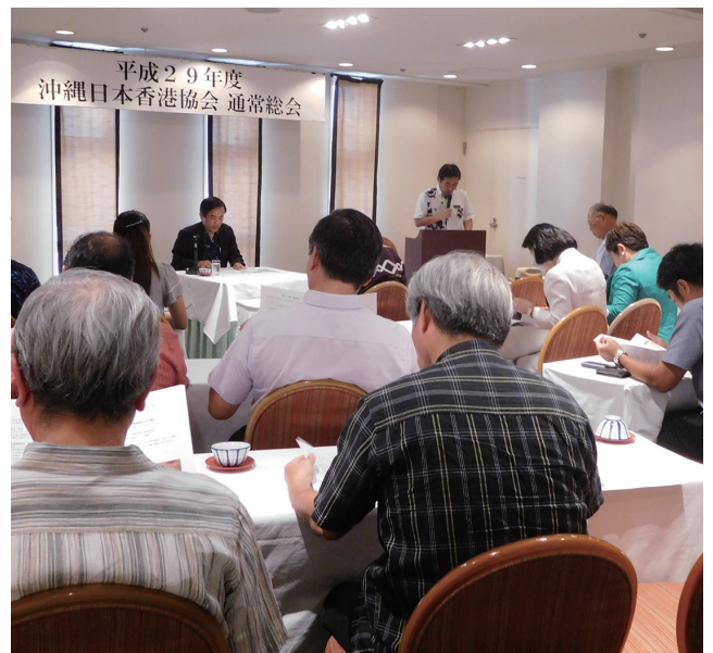
平成29年度沖縄日本香港協会総会

併せて、「沖縄ナイト in 香港2017」の前日には沖縄観光の方針ならびに取り組みを発信する「沖縄観光セミナー・沖縄観光商談会」も開催され多くの参加者があった。