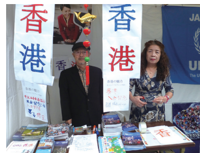
中京日本香港協会ブース

際、県内企業1,200社が中国に進出、県内45,000人の中国人在住者など両国の関係強化の必要性に触れられた。それに伴い日中両国の交流としてイベント「日中友好錦秋