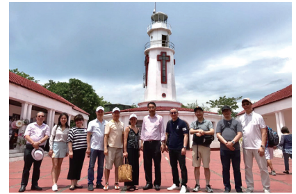
各国代表との交流を深めた コレヒドール島ツアー

参加したメンバーの中には銀行家、製造業の社長ら多くのビジネスマンがいた。このネットワークを活用しない手はない。チャンスがあれば、積極的にアジアフォーラムへ参加することをお勧めしたい。