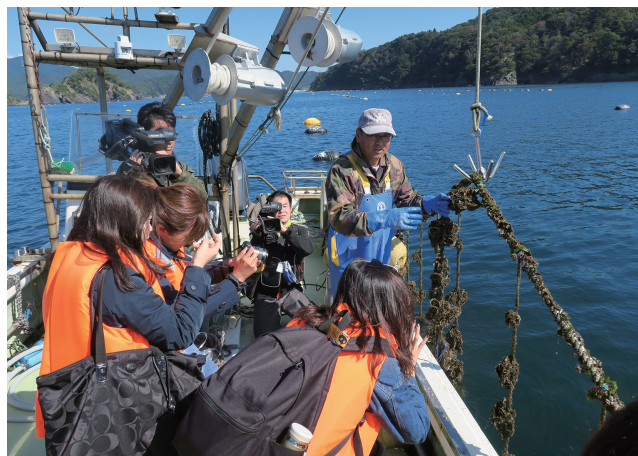
狐崎漁港カキ養殖場視察