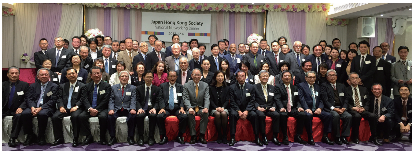
日本香港協会全国の11協会がすべて香港に集まりました