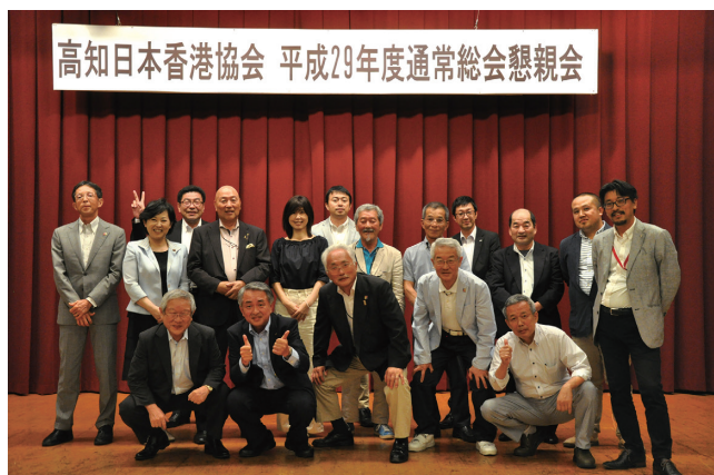
通常総会懇親会 参加者のみなさまとの記念撮影

ただきました、当日は41名の方にご出席をいただき、高知県の食材や特産品などの高知県下の企業様の香港を基点とした海外展開に貢献す