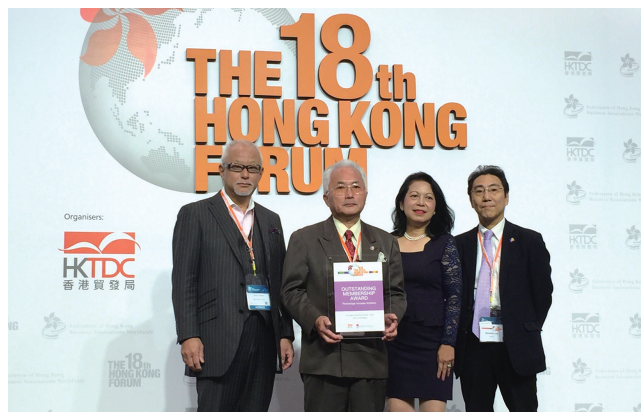
「アウトスタンディング・メンバーシップ・アワード」を受賞する高知日本香港協会の皆様

また、2日目午前のプログラム「アジア電子商取引サミット」は12月6日開催の香港貿易発展局主催の1日プログラム「アジア電子商取引サミット」の一部に参加するという、初の試みが行われました。このサミット自体が今年初開催のサミットで、eテリングの戦略と技術に関する最新のトレンドと実践方法、新世代のeテリングについて、越境eコマース、社会コマース、サイバーセキュリティ、さらにはオムニ・チャンネル戦略の機会と挑戦について等、急速に拡大するeコマースビジネスについて、世界で活躍するビジネスリーダーの方たちの講演を聞くことができました。また2日目最終プログラムとなるオプション視察ツアーでは、地域クーリングシステムを見学できる旧啓徳空港跡に建設された施設「啓徳開発計画」、廃棄エネルギー変換施設の「T-Park」、仏教建築物である「東蓮覺苑」の3プログラムの中から、普段あまり訪れない場所へ、おのおの自由に選択した視