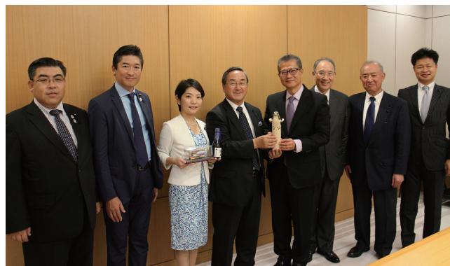
ポール・チャン財務長官との意見交換会