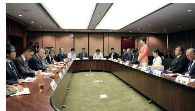
ミッションツアーでの意見交換会

末筆ではございますが、この場をお借りしまして、訪問団を快く迎えてくださった香港の皆様、各企業、各団体の方々にはあらためて御礼を申し上げます。