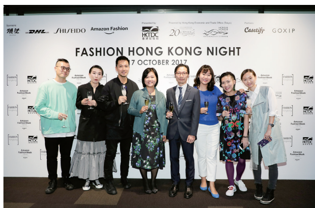
主催者とデザイナーの記念撮影

今回のFashion Hong Kong事業では、17日夜のファッションショーのほか、10月2日～31日に港区南青山のショールーム「H30ファッションビューロー」にてバイヤー向けの展示会を開催しました。また、10月14日～31日に新宿区新宿の「ルミネエスト デスティネーション トーキョー」、10月24日～11月2日に渋谷区神宮前の「ラフォーレ原宿 コンテナ」に期間限定店を開設。ショーに参加した4ブランドの最新コレクションのほか、香港のファッションアクセサリブランドを展示販売しました。