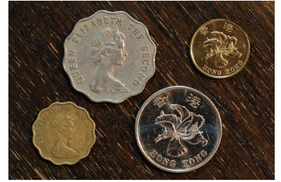
植民地時代と現在の香港ドルコイン (写真：小柳淳)

2009年から2016年の7年間居住で永住権ももらえたのですが、その単身赴任のもう一つの楽しみは映画でした。学生時代、否、小学校時代から東映時代劇やアメリカ映画にか