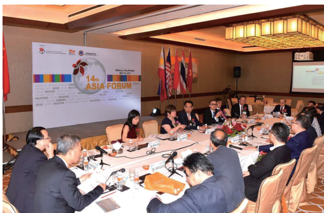
活発な意見交換が行われたアジアフォーラム