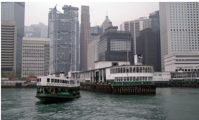
2006年の移転直前のスターフェリーセントラル埠頭

1976年商社の繊維部門で生まれて初めての関西の生活を「元気いっぱい」をモットーにスタートし、ソ連邦貿易部隊から3年目に国内アパレル取引に異動し、国内縫製から海外生産にシフトしていた時代の先鋒を切りました。当時の大阪は「日本のマンチェスター」と言われた繊維産業隆盛期から陰りが出て、1980年代後半には東京に多くの企業が市場の重点を移していく流れをつぶさに体感したものです。1988年1月に憧れのニューヨーク駐在員として転任するまで、沢山の香港出張を繰り返して、香港が大好きになりました。最近では感じられなくなった熱気ムンムンのセントラルからCauseway Bay (CWBという言葉がもう今では遠い昔のようですが)の街並みと人の流れ、とりわけ欧米人には憧れもあったのか？ まぶしいものを感じた若い時代でした。九龍半島のTST (チムシャツイ、という言葉が最初はどうにも覚えられませんでしたが)の雰囲気、沢山の日本人観光客でにぎわったペニンシュラホテル (今では中国人にとって代わられました)、広東料理と大好きな沢山の銘柄のビール、枚挙にいとまがない思い出も、一番の喜びは、意外にも沢山の自然が残っており、山歩き、海遊び、満喫できたことです。7年間の間に全ての山と島を回りました。しかも狭いところなので、交通のアクセスも最高でした。