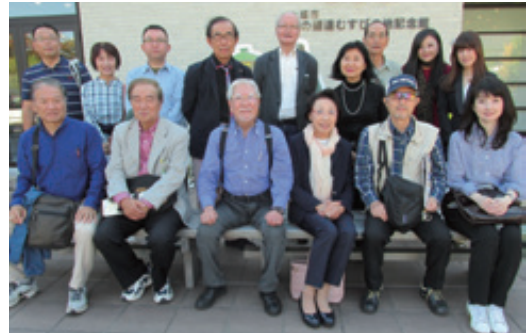
奥の細道芭蕉句碑巡り

が貞享元(1684)年～元禄4(1691)年にかけて元々三重県桑名の出身ながら、東海3県特に美濃路の当時豊かな自然そのものが俳句に適した土壌その中で岐阜大垣を奥の細道の「むすびの地」に選ぶなど4度も訪れた理由が、弟子たちが俳句の作品「水」に関する作多く湧水が至る処に見られる「水の都」が由縁とするのが理解できる。特に秋季の大垣が美濃俳壇として言われる物件が大垣城近辺散策すると見いだされる。