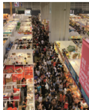
フード・エキスポのパブリックホールはクーポン券を握りしめて品定めする一般来場客で埋め尽くされた

なお、同時開催となったお茶の総合見本市「香港国際茶展」には、六大中国茶（青茶・黒茶・緑茶・紅茶・白茶・黄茶）、紅茶、日本緑茶といった茶葉のほか、茶器、茶藝用品、茶関連用品などが出展され、各ブースで世界のバイヤーと熱のこもった商談が繰り広げられました。日本からは12社が出展し、会場内に設けられた茶室では、お点前が披露され、訪れたバイヤーの目を引いていました。