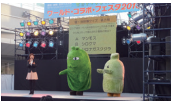
ワールド・コラボ・フェスタ2015