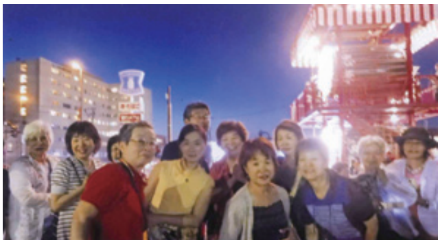
「五所川原の立佞武多」とってもよかったわ

棧敷席の目の前を「ヤツテマレ」の掛け声でゆっくりと現れる立佞武多を見て、感激のあまり抱き合う同級生2人、とても楽しみにしていた研修でした。幻想的で感動を呼んだ夏祭り、市民の心意気が感じられた「街・人・心」が躍動する夏祭りでした。会員相互の親睦が図られ、参加者からは「とってもよかったわ。来年も又お願いしますね」などの声が上がったほどでした。