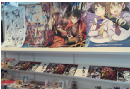
日本アニメ・マンガ専門学校在校生・卒業生のオリジナル作品展示

今回は、新潟市と共に「マンガ王国新潟」を世界にPRするために出展させて頂きました。新潟市のブースは、新潟出身のマンガ家作品のマンガやポスター、グッズ等を展示し、新潟市PRオリジナルアニメーションの上映や、新潟出身の演歌歌手「小林幸子」と新潟ご当地アイドル「Negicco（ねぎっこ）」による、新潟紹介プロモーションムービーの上映など、新潟の良いところを沢山紹介させて頂きました。日本語のマンガにもかわかわらず、熱心に読んでいる方や、オリジナルアニメーションを楽しそうに観ている方など、とても楽しんでもらえ