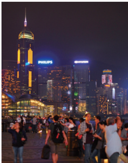
香港はグローバル拠点

・日欧のEvolution（段階的変革）に対しRevolution（大変革）：西欧も似ているが、日本では地道に発展的に目的に到達しようとする。アメリカは画期的な新しいやり方を先ず模索し、社会を変え新しいマーケットを作ろうとする。中国は目的が決まると早急に達成しようとし、かつては種々世界的発明もあったが、最近は先進国の模倣に走る。中国は意外だが古いものを余り大事にしない。