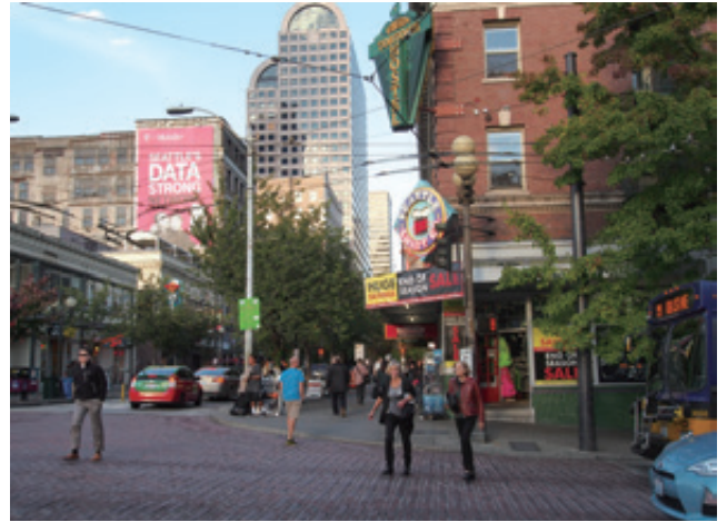
新しいものを生み出すアメリカの街

また中国人が意外に日本をよく知っていることも知らない。一年前に創刊された「知日」という日本を紹介する月刊誌は既に