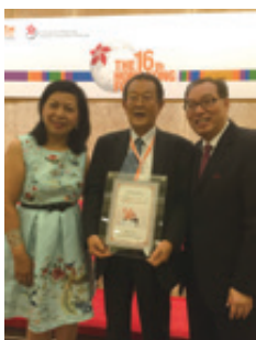
↑ Farewell Dinnerにて ➡