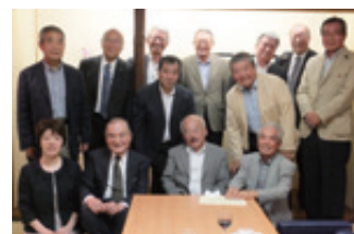
両協会の懇親会（10月1日）

お気軽に、当協会のイベントにお出かけください。シンガポールやアジア全般に関してのお問合せやご相談も、随時受け付けております。