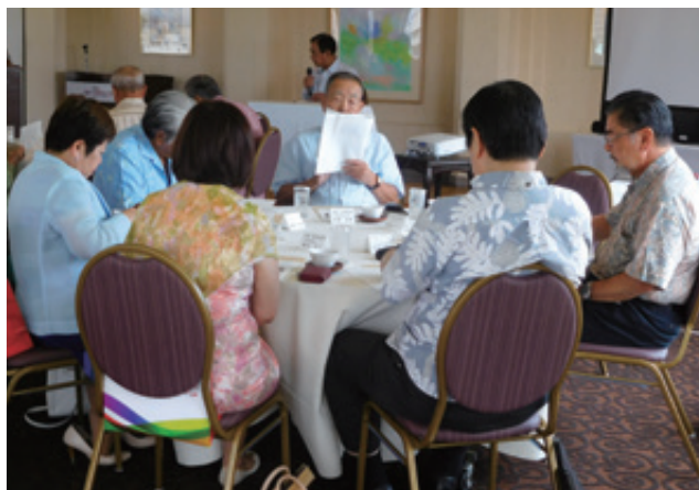
沖縄日本香港協会 平成27年度総会 られたのは以下の点である。

平成27年9月15日、沖縄日本香港協会の総会がクラウンプラザホテル沖縄ハーバービューにて開催された。平成26年度の事業報告および収支決算、平成27年度事業計画および収支予算が承認された。平成26年度、沖縄日本香港協会は香港貿易発展局と沖縄県のMOU締結を支援すると共に、香港における調印式に際し香港・マカオの経済視察を実施、香港フードエキスポを視察するなど沖縄県と香港の経済交流と相互理解を推進した。平成27年度も香港フォーラムの参加や春節経済セミナーの開催、沖縄大交易会の開催協力等を実施していく。