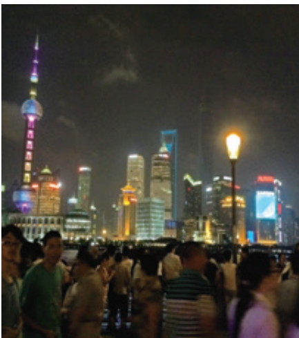
中国パワー溢れる上海の夜

日本はもっと米中両国民がどんな人たちなのかを知らなければならぬ。なかんずく中国について日本人の多くが「同文同種」だと思っている。それ故に中国人がどんな人達なのかを知ろうとしない。そのためビジネスでも政治でもうまく付き合えないでいる。したたかな交渉術への対応も十分に出来ないでいる。