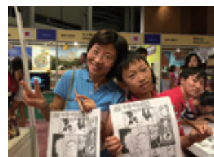
親子でマンガ原稿を仕上げました。とても上手です。

これからも、日本のアニメ・マンガを通して日本の良さを海外に伝え、国際交流に貢献していきたいと思ひます。この度は、貴重な機会を頂きありがとうございます。