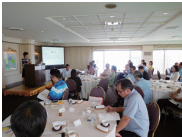
昼食懇談会の様子