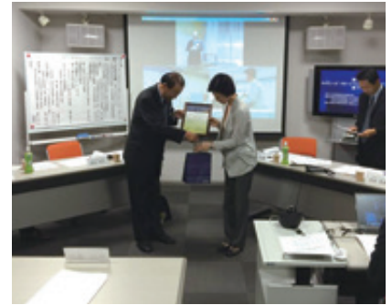
東京会場での修了式

学商学院華人経営研究センターと香港貿易発展局が協力をしています。その最大の特徴は「華人経営」を「国情、儒教、兵法、華人ネットワーク」と分類し、それを「理論」「実践」の両面から分