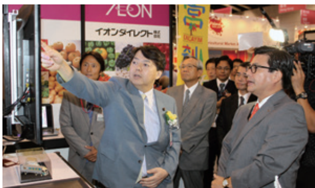
イオンブースを視察した林農水相は官民共同のウェブサイトに強い関心を示した