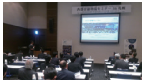
多くの参加者が集まり、熱心に聴講いただきました