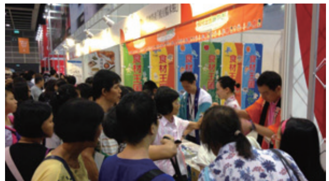
大盛況の宮城ブース

8月13日(木)～17日(月)と香港最大級の総合食品見本市「FOOD EXPO 2015」において「東日本美味しい魅力展」(外務省主催)が開催されました。被災地を含む東北、北関東地方の魅力や安全性等の正確な情報発信とこれらの地域の魅力の体感からの東日本の知名度、ブランド力を高めるためのものでした。宮城ブースでは、ずんだ餅の試食提供や観光パンフレットの配布などを行い、香港の皆様にも宮城の“食”と“観光”のPRを行ったところ、大変な好評をいただきました。