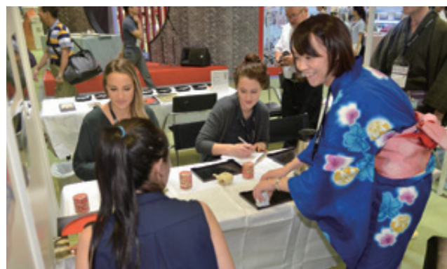
香港国際茶展では浴衣姿の出展者が各国のバイヤーに日本茶の楽しみ方をアピール