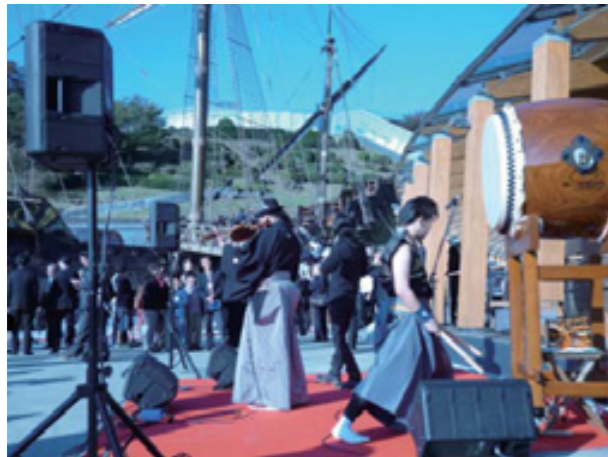
力強い音楽は400年前の当時の出帆を想起させました

11月1日(金)、2日(土)と2日間にわたり、東日本大震災チャリティ・コンサート「ひびき合う心PART3」として、慶長遣欧使節出帆400年を記念するサン・ファン・フェスティバル・コンサートを開催しました。