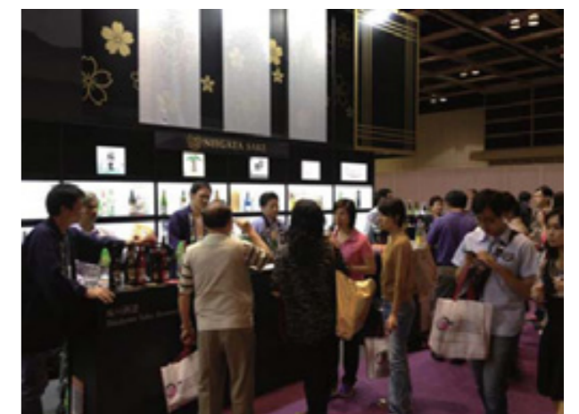
「香港国際ワイン&スピリッツ・フェア2013」出展の様子