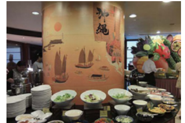
キンバリーホテル内のレストラン

その後、沖縄県産食材の販路拡大の一環として、香港の高級ホテル「キンバリーホテル」で那覇空港にお