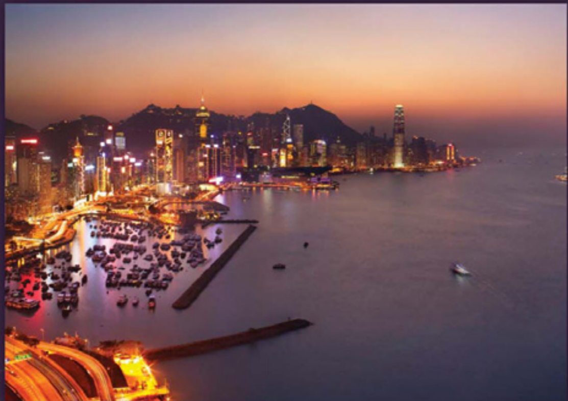
ホテルからのハーバービュー

2013年ワールド・ラグジュアリー・ホテル・アワードにおける ラグジュアリーシティホテル部門2年連続受賞はじめ、 2009年の開業より栄えある数々の賞を20以上受賞している 5つ星ホテル・ハーバーグランド香港は、 ハーバーフロントに位置し828の全客室からヴィクトリア湾の 眺望を楽しんで頂けます。またミニキッチンを備えたお部屋・ スイートは長期滞在にも最適です。 総面積12,685平方フィート（約1,178m 2 ）の会議室及び宴会場と、 5つのレストランを館内に備えております。 特別なイベント・ご宿泊に是非御利用下さい。