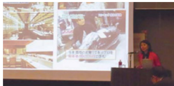
重光取締役の講演の様子

中小・零細企業が海外展開を目指す場合、様々な課題がありますが、元々は地方の小さな企業が世界的な企業にまで成長した実例があること、その秘訣を学んでいただき、1社でも多くの企業が海外に雄飛されることを祈っています。