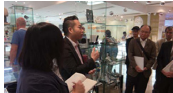
デザインギャラリーを視察

視察の目的は、①マカオにおけるカジノを含むIR(統合型リゾート)施設②香港コンベンション&エキジビションセンター③香港における沖縄県産食材の販売状況を目的に3泊4日で実施されました。香港貿易発展局大阪事務所の協力で、香港コンベンションセンター、デザインギャラリー、中小企業センターを視察することができました。