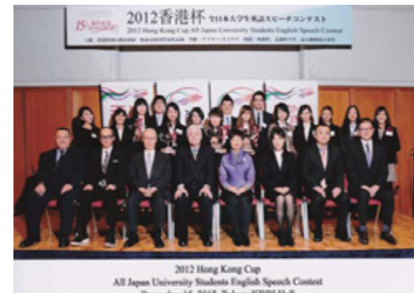
HKカップ英語コンテスト (前列左から3人目が筆者)

返還前に香港に駐在した際に多くの香港の有識者と意見交換したときには、「一国二制度」と言っても返還後の香港について先はどうなるかわからないとか、大きく発展を遂げる中国経済に飲み込まれてしまうのではないかと、上海のような都市に香港の役割が奪われてしまうのではないかと懸念を述べる人がかなり多かった。しかし、その後の実績は困難なこともあったであろうが、それらを克服し、強靱性、