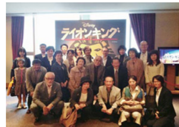
「ライオンキング」観劇会参加の皆様