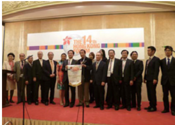
フェアウェル・ディナーにてベスト・アテンダンス・アワードの表彰を受ける日本香港協会

■第14回香港フォーラムにて、日本香港協会が5年連続「ベスト・アテンダンス・アワード」を受賞!