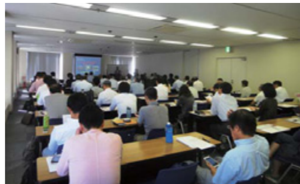
香港・中国ビジネスセミナー 会場の様子

講演の中で園田先生は、拠点としての香港の地政学的理解、中国へのゲートウェイ、製品・サービスのショーウィンドウ、中国から年間3000万人の観光客のイン