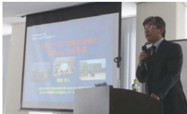
園田茂人教授 (東京大学大学院情報学環 / 東京大学東洋文化研究所)