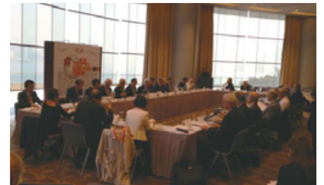
香港ビジネス協会世界連盟年次総会

モーション・ディレクターの乾杯の挨拶があり。香港に年一度の交流ということもあり、今年は120名以上の方に参加頂きました。また、今年新たに設立された新潟日本香港協会からも10名の皆様が参加されました。今年ご参加いただけなかった方は、是非来年ご出席いただき、メンバーとの交流を深めていただければと思います。