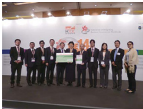
ベスト・イニシエティブ・アワードを受賞する沖縄日本香港協会

全国交流会では本年の幹事であるNPO日本香港協会の進行のもと、全国連合会國場会長の開会挨拶、石井哲也首席領事からの来賓挨拶、ラルフ・チャウ香港貿易發展局プロダクト・プロ