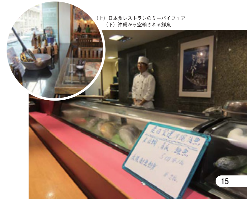
(上) 日本食レストランのミーバイフェア (下) 沖縄から空輸される鮮魚