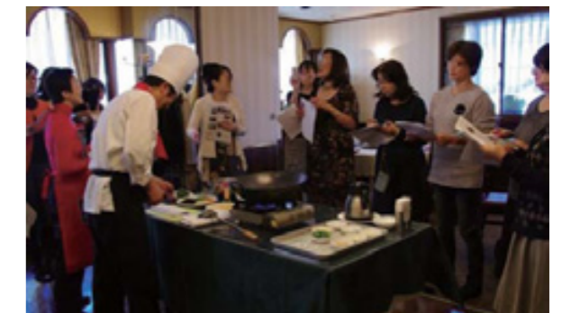
乾物利用の料理を学ぶ会員たち

毎回大好評の「パウヒニア会」主催、3回目のお料理教室が11月16日(土)に飯倉の「新北海園」で開催されました。