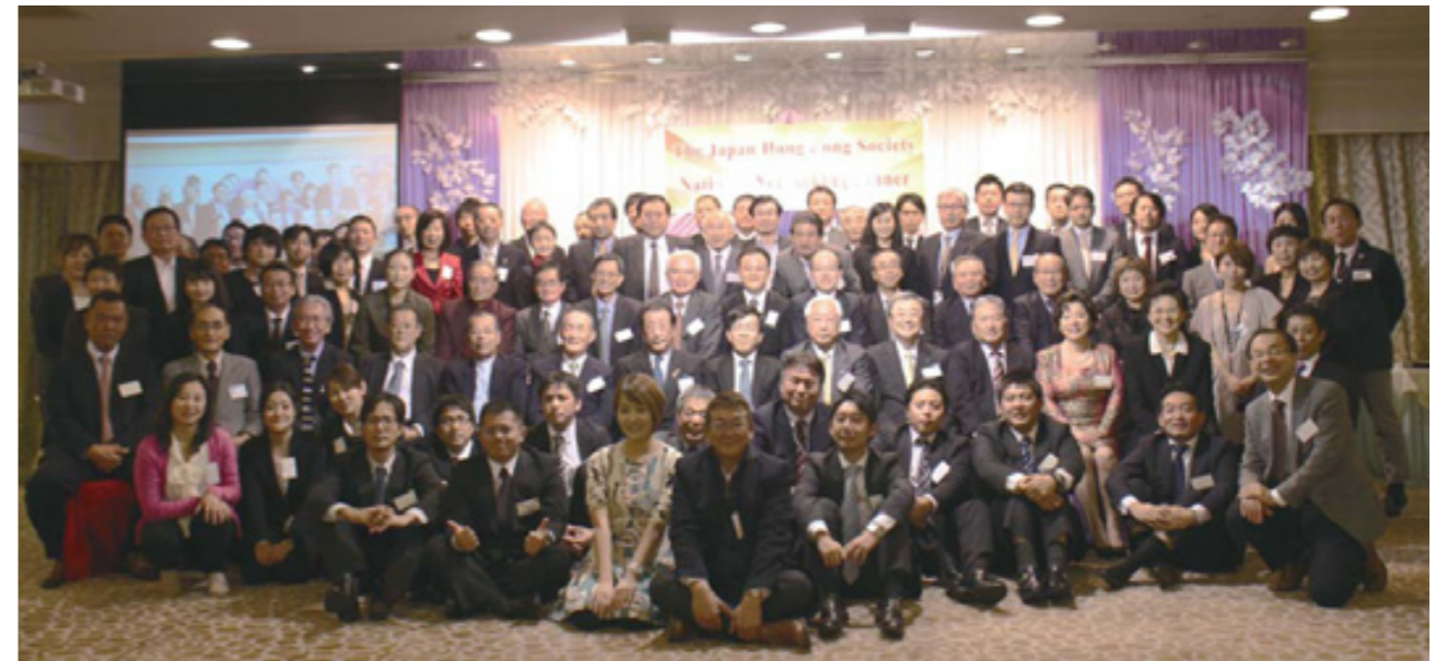
香港ビジネス協会世界連盟年次総会