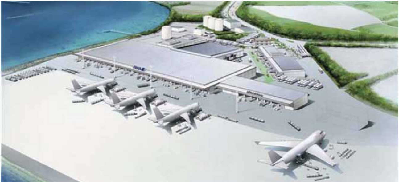
空港全景イメージ①