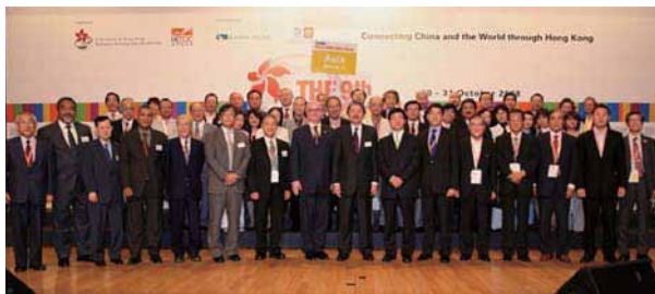
香港フォーラム2008 昼食講演会

記念すべき第10回目を迎えます香港フォーラムが、本年12月1日(火)・2日(水)の2日間にわたって開催されます。当フォーラムは、全世界の香港ビジネス協会世界連盟のメンバーが香港に集まり、メンバー間の交流やビジネスの活性を図ってきました。昨年は各協会より90名以上の皆様にご参加いただきました。今年もまた多くの皆様のご参加をお待ちしております。全国連合会としましては、会員の皆様が参加しやすいようにパッケージツアーを企画いたします。詳細につきましては全国連合会事務局までお問い合わせください。