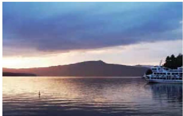
夕暮れ時の阿寒湖畔から雄阿寒岳連なる山々を望む

最後は、観光船の棧橋の風景がタイトルバックに使われ、主人公が立ち寄る温泉街の居酒屋が印象的な阿寒湖です。