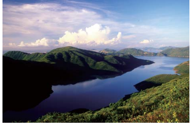
写真集「The Legend of Sharp Peak」から抜粋

具体的な事例はあえて挙げないが、「大自然に囲まれた都会」という概念、そしてそれに合致する実態の存在はそれほど奇異には感じられない。以前どこかで使って、自分ではいたく気に入っている表現だが、香港を香港たらしめている最大の特徴は、「大自然を懐に取り込んだ近代的大都市」であることだ。一昔前までの香港であるならば、市街地らしきものは一筋の海面を挟んで、九龍半島先端部とこれに向かい合う香港