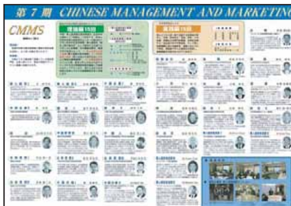
パンフレットより

過去6回関西で開講され大好評をいただいております「チャイニーズ・マネージメント・アンド・マーケティング・スクール(CMMS)」が、場所を東京に移し全30回の講義を本年9月より開講します。著名な大学教授・中国ビジネス専門家・華人経営者を講師にお招きし、華人企業経営を理論・実践の両方面からアプローチして解明していきます。対中華圏ビジネスの担当者様および華人についてより深く学びたい方にはうってつけの講座です。全国連合会事務局に資料がございますので、是非お問い合わせください。また、全国連合会のウェブサイトでも詳細をご案内させていただきます。