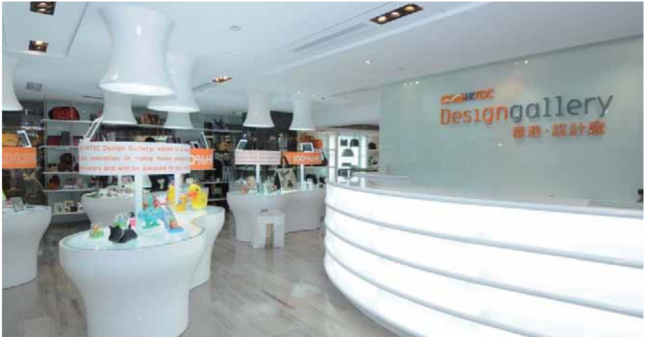
斬新なデコレーションの店内風景