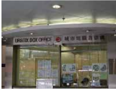
上環文娛中心のURBTIX窓口

香港は、美食・ショッピング以外、何もないと思っ ている人が多いと思いますが、意外や意外、年に何度もビ ッグアーティストのコンサートや、ブロードウェイやロ ンドンのミュージカルなどの来港公演が開かれている のです。欧米のアーティストは日本や韓国での公演 と香港、台湾を順に回っていくことが多く、運がよけ れば日本での機会を逃してしまっても、香港で見るこ とができたりします。また、地元の演劇や香港POPSの コンサートも数多く催されています。演劇にはオペラ 上演のように字幕がつくこともあります。