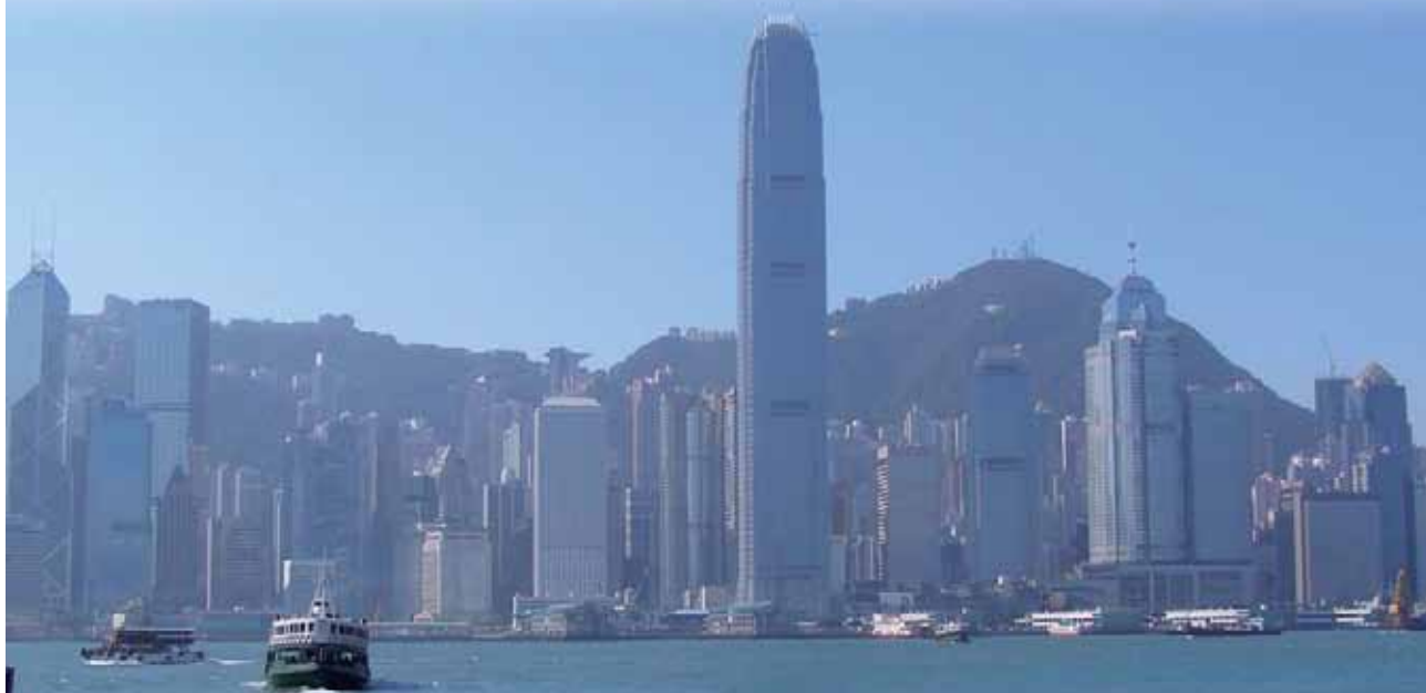
セントラルの海辺に直立する IFC II。最高部はピークトラム山頂駅と同じ高さ。