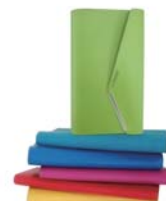
リサイクルレザーを 再加工した文具類