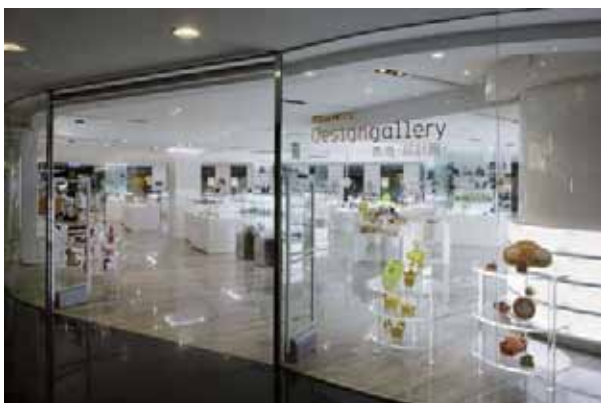
「デザイン・ギャラリー」全景・入口