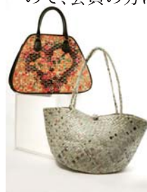
古新聞紙から作った ハンドバッグ

適な商品が手頃な値段で販売されています。400のメーカーから、4,000の品目が常時取り扱われていますが、品揃えは毎月見直されておりますので、香港トレンドの最先端を垣間見ることができるのも特徴です。最近では、エコ製品の取り扱いが増えており、リサイクルレザーを使用したシステム手帳や財布、米の袋に取っ手をつけた買い物用エコバッグなどユニークな商品も販売されています。見本市などで香港へ行かれる方は、ぜひ本「デザイン・ギャラリー」へお立ち寄り下さい。日本香港協会が所属する香港ビジネス協会世界連盟の会員証を提示すると、10%OFFの特典もありますので、会員の方はこの機会をお見逃しなく!