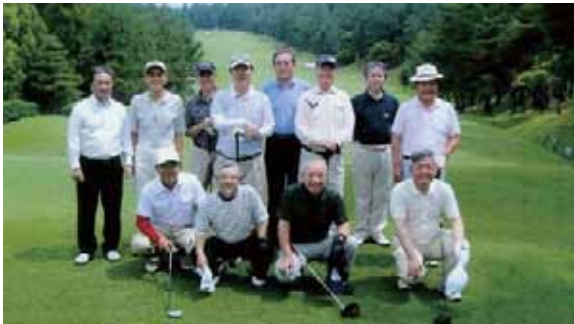
ゴルフコンペ参加者による記念写真