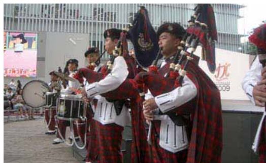
ポリスバンドによる重厚な演奏