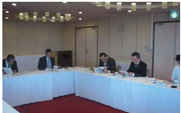
理事会・総会の様子