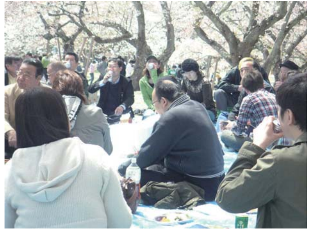
お花見会での至福のひとつ

三神峰公園は多種類の桜があり、長い期間花見が楽しめる公園で、今回は枝垂れ桜が満開、ソメイヨシノは散り始めて桜の絨毯となって、参加者の皆さんに大変喜んでいただきました。