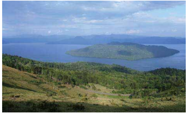
美幌峠から屈斜路湖、中島を望む

次に、映画ではドライブのワンシーンに登場する美幌峠からは、「屈斜路湖」、日本最大の湖中島である「中島」の一大パノラマを望むことが出来ます。また、屈斜路湖周辺には温泉が多数あり、中でも湖岸を掘ると温泉が湧き出す「砂湯」が有名です。