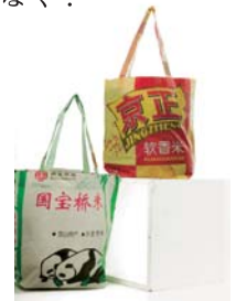
米袋を再利用した エコバッグ