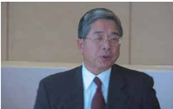
挨拶をされる並田会長

今年度の福岡日本香港協会の活動におきましては、香港貿易発展局及び昨年10月に発足された日本香港協会全国連合会の支援のもと、日本と中国・香港の最新の経済状況を発信できるよう講演会やセミナーなどを開催し、より確実な情報提供が出来ればと考えており、市内の公的経済・貿易推進団体と協力しあい相互間の事業の効果を上げていければと思います。また、新たな企画・立案をし、お役に立てるよう努力してまいりますので、引き続き理事及び会員の皆様、香港貿易発展局、日本香港協会全国連合会並びに各関係団体・企業の皆様の格別のご理解とご指導ご鞭撻をお願い申し上げます。