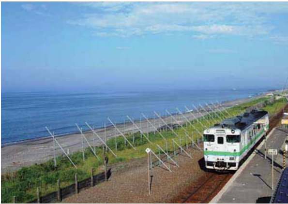
北浜駅展望台からオホーツク海、知床連山を望む

映画では、ヒロインが北海道にはじめて降り立つ場所として登場するのが、JR釧網本線北浜駅です。