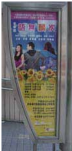
ミュージカルの街頭看板