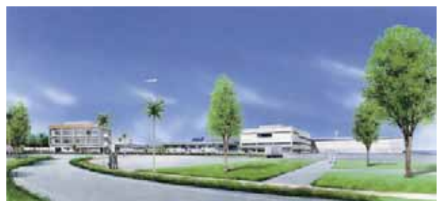
空港全景イメージ②

香港は、美食の都市であり、食の安全に関する関心も高い。安心・安全かつおいしい沖縄の野菜・果物がより多くの香港の家庭の食卓に並ぶことが期待される。