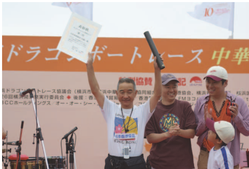
午後の部3位入賞の快挙!

予選の第一走・第二走を経て、チームワークも上々、午後3時半…「九龍」は、優勝候補「CICライジングスター」と対戦することになった。決勝もう一艇はやはり強豪「オイスターズ」である。沸き立つ応援団、決勝特有のもったいぶったスタート合図。「ドン!!」。出だしはよく、中盤にかけてもまずまずの疾走ぶり。しかし後半にさしかかって顔を