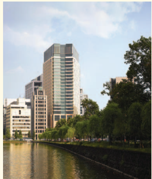
ザ・ペニンシュラ東京

他のザ・ペニンシュラでも各種特典の付いたお得なプランを実施しております。また香港、ニューヨークそしてバンコクのホテルでは2泊目が無料となる“ザ・スイートライブ”でさらに贅沢なご滞在がお楽しみいただけるプランをご用意いたしました。