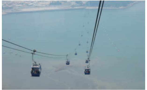
視界抜群アジア最長のケーブルカー

ランタオ中西部のゴンピンは海拔460メートルに位置する102ヘクタールの高原です。高度のせい霧や湿気が多く、土壌は肥沃です。修道僧や僧侶がこの無垢の土地