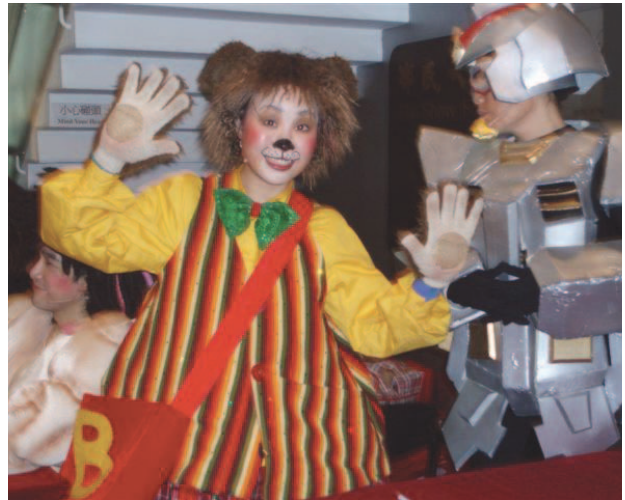
出演者と楽しくコミュニケーション、写真撮影や握手もウェルカム(06・12・15「錫錫啤啤熊」上演後のロビーにて)

あれからずっと、香港に行く前には必ず劇場組合をチェック、でもタイミングが合わず、観劇かなわず。そして、何回か渡港しているうちに香港在住の友人もでき、かなり気ままに歩き回れるようになりましたが、言葉の方はなかなか