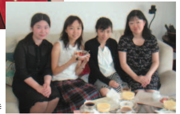
香港の学生を自宅へ招待

サロンで、もう何年ものおつきあいです。夜は、多国籍の友人達や卒業した教え子達とレストランでディナーをいただくこともあります。4年前に、私のクラスの学生3人を山形に連れて行って、ホームステイや交流プログラムを実施した事がありました。その時のメンバーとは、今でも定期的に会っています。それから家に帰って、娘に添い寝をして、2時間くらい仮眠を取ります。それから、自分の研究や執筆、授業準備などをします。忙しい毎日ですが、これからは山形と香港の交流で何かお手伝いをさせていただければと考えています。