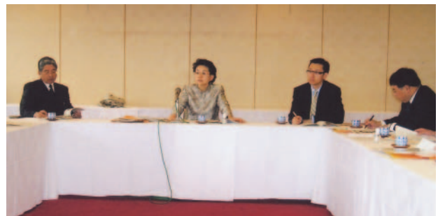
福岡支部総会における香港貿易發展局幹部