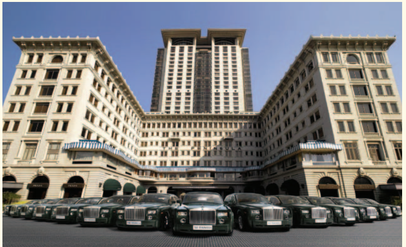
ザ・ペニンシュラ香港とホテル仕様のロールスロイス

ザ・ペニンシュラホテルズはフラッグシップであるザ・ペニンシュラ香港はじめニューヨーク、シカゴ、ビバリーヒルズ、バンコク、北京、マニラでホテルを運営しています。さらに2007年9月1日、丸の内にザ・ペニンシュラ東京がいよいよ開業、東京の外資系ホテルでは十数年ぶりとなる、一棟丸ごとホテルという圧倒的な存在感を現します。伝統的なペニンシュラホスピタリティーによって生まれる贅沢な心地よさと共に、東京の新たなランドマークとして根付くことでしょう。