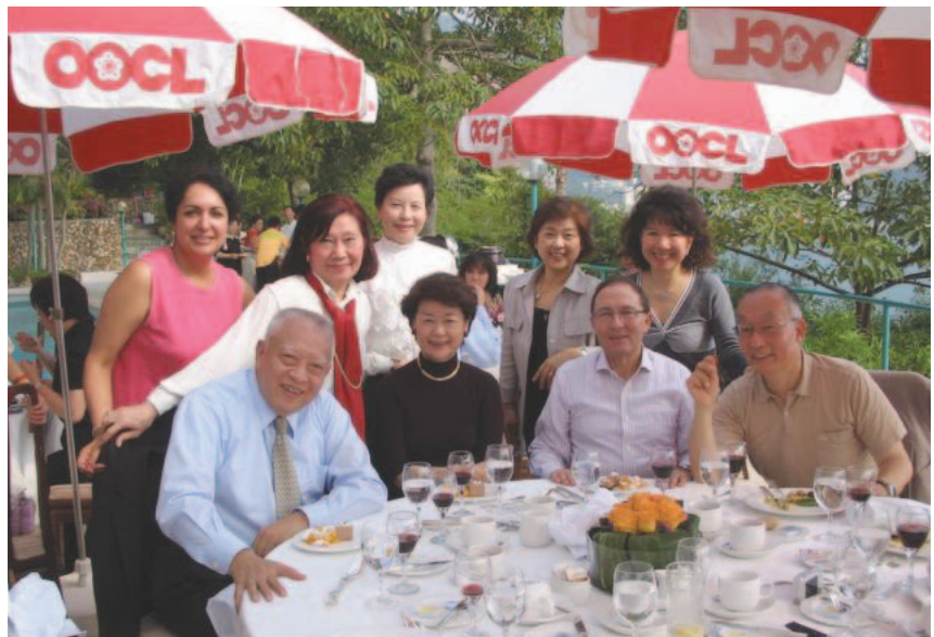
前香港行政長官 董建華氏との再会を楽しむ(2006年11月)左端:董建華氏、右端:筆者

6. 香港経済の将来を見通すに当たって注目すべきは香港の国際競争力に関する最近の調査結果である。スイスの有力なビジネス・スクール国際経営開発研究所では、毎年世界各国地域の「マクロ経済」「政府の効率性」「ビジネスの効率性」「インフラ」の四分野について多くの統計を集計し、調査を行い、各国地域の競争力に順位を付けているが、去る3月の発表では、香港は米国、シンガポールに次いで第3位となっている(06年と05年においては米国について第2位。なお、本年、日本は第24位、中国は第15位)。また、日本経済研究センターが毎年実施している潜在競争力調査では、今後十年間に一人当たりのGDPがどれだけ増加する可能性があるかを「企業」「科学技術」など8分野の指標を分析し、各国地域の順位付けをしているが、本年1月の発表では、香港は昨年引き継ぎ第1位となっている。これは、一昨年の第3位から、米、シンガポールを