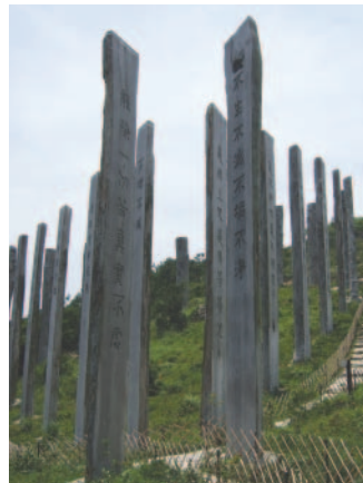
心の安らぎを誘う聖地

以上ゴンピンの数ある名勝のごく一部を紹介したがケーブルで登り、一帯を歩き回りバスで帰ればわずかな時間で香港の魅力をたっぷり味わうことができるだろう。 以上