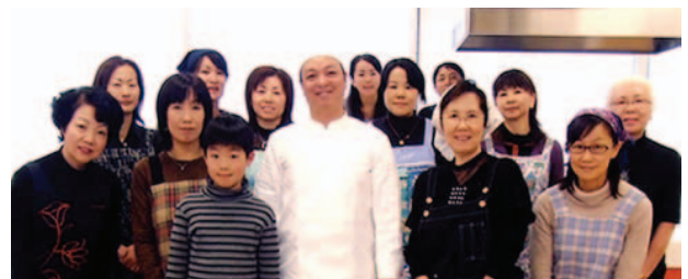
女性料理教室が終わって記念写真

今後の活動としては、引き続き料理教室を開催するほか、新たに広東語・二胡・香港映画・太極拳等の教室の開催、クリスマスパーティー・春節パーティーの開催等、主に女性の興味に則した文化面の活動を中心に「会員相互の親睦」と「香港の理解と情報の発信」を目的として、活動をより活発化させていきたいと考えております。