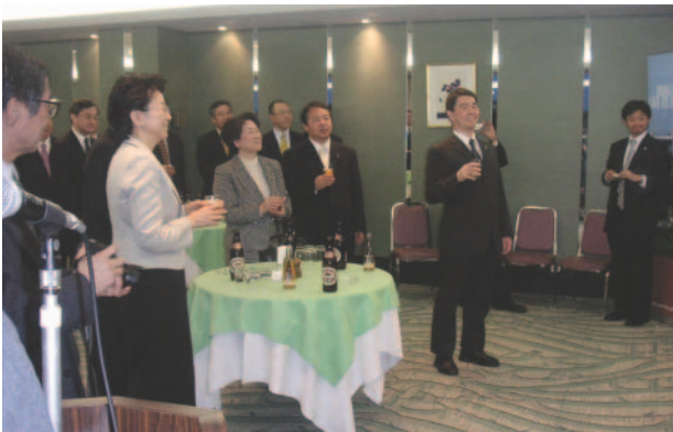
祝賀会での楽しい歓談のひとつ