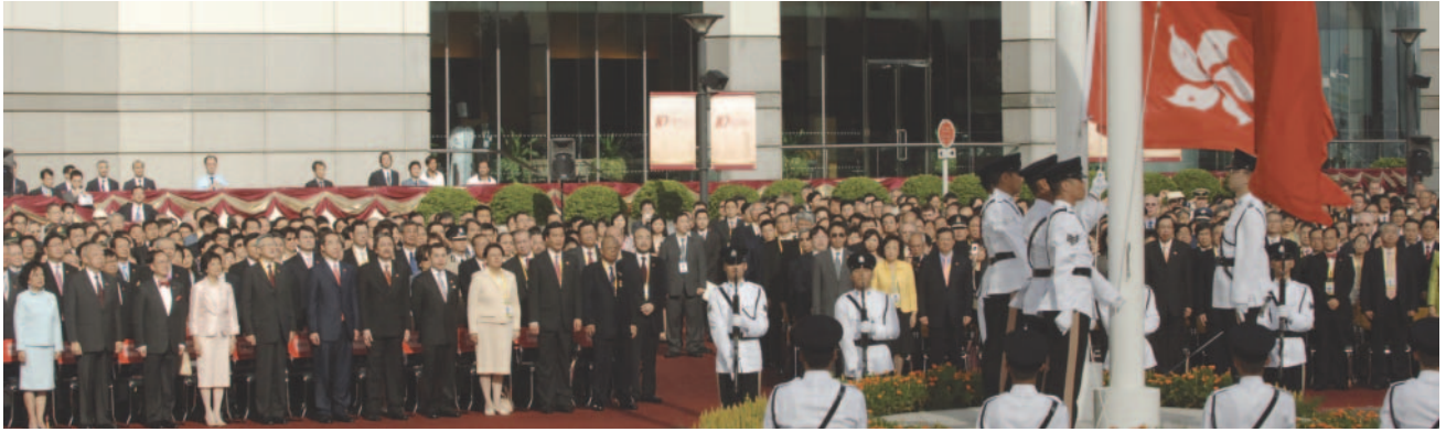
10周年式典で行われた香港特別行政区旗と中国国旗の掲揚式