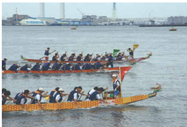
3日間で160チームが参戦