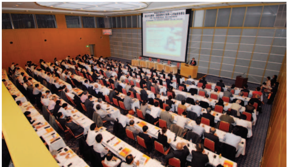
シンポジウム会場にて